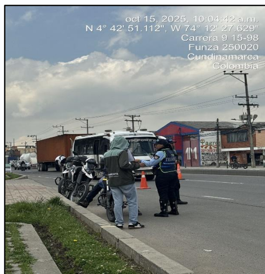
Ilustración No. 3. Operativo pedagógico fuentes móviles.