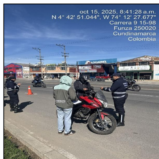
Ilustración No. 2. Operativo pedagógico fuentes móviles.