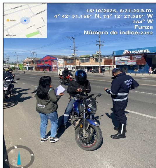
Ilustración No. 1. Operativo pedagógico fuentes móviles.